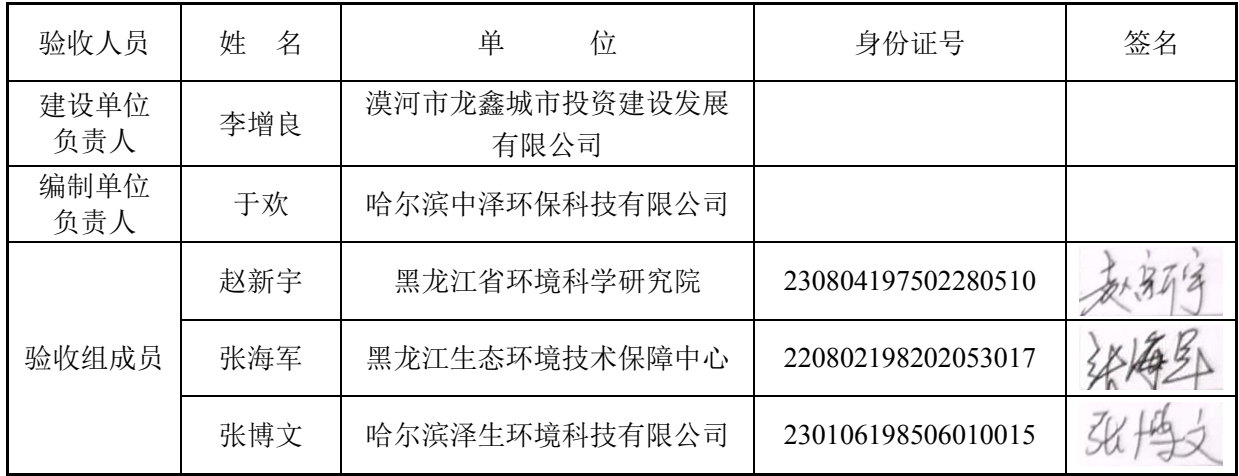
漠河市机场改扩建工程二号石场竣工环境保护验收工作组人员名单